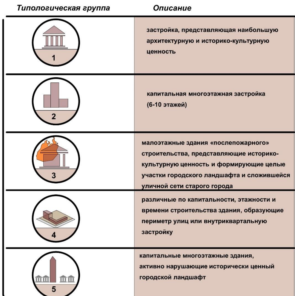
Рис.3. Классификация старой застройки. Сост. Д. Магадеев