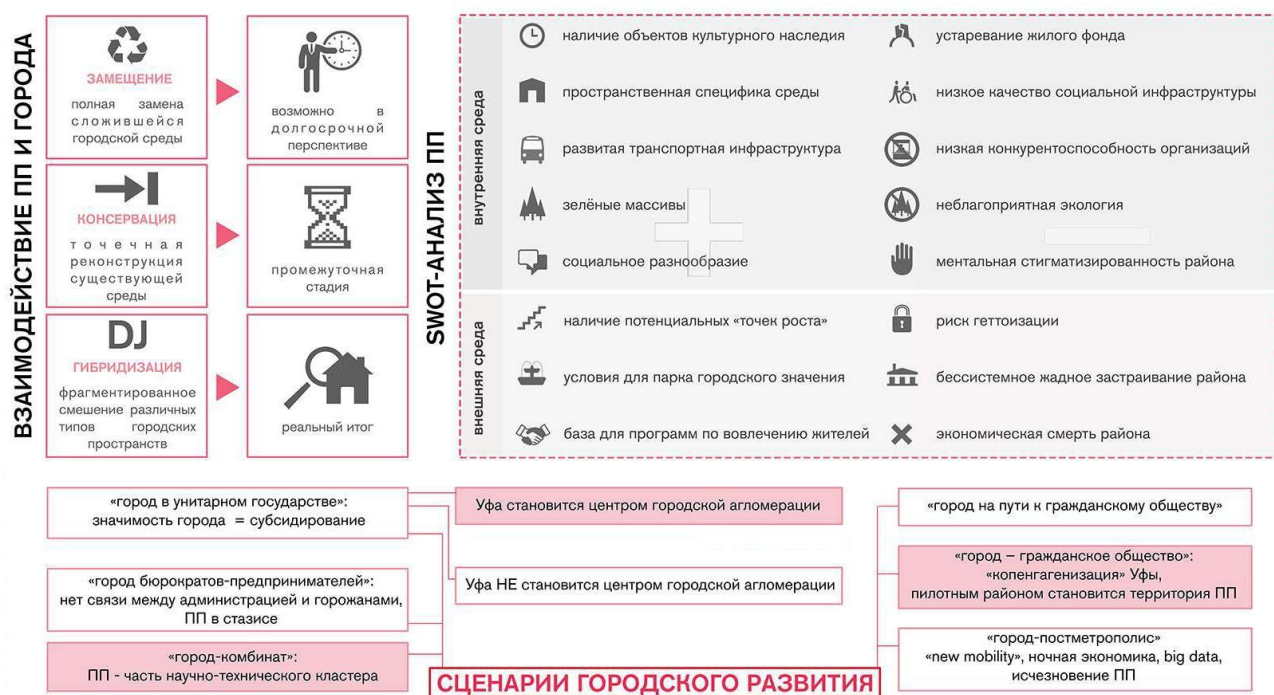
Рис. 1. Сценарии городского развития. Сост. Д. Ахметзянова.

Соркин М., говоря об унификации городских пространств посредством симуляции методов «нового урбанизма» и музеификации исторической застройки, предупреждает о неизбежном сглаживании существующего контекста и перспективе превращения городов в архитектурный «Диснейленд» с видимостью средового разнообразия [3]. Поэтому в том случае, если приоритетными становятся реновация жилого фонда и совершенствование социальной инфраструктуры, необходим более демократичный, более здоровый подход к регулированию городских процессов, закладывающий в основу их разнообразие и изменчивость.